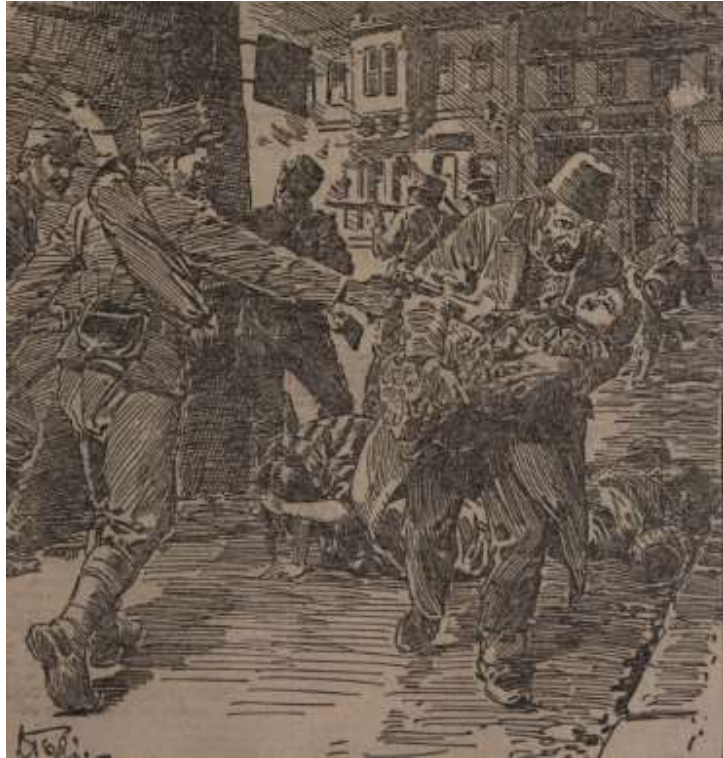
Çizim 3: Selanik'te Müslüman Türklere Yönelik Saldırılar ( Illustrierte Kronen Zeitung , "Die Bluttage von Saloniki" 30.10.1912. s.9)

haricinde bir adet de Sırp müfrezesinin bulunduğu bilgisini verdiği anlaşılmaktadır. Buna rağmen Alman elçilik ve konsolosluk raporlarında Venizelos'un derhal Selanik'teki kıta komutanına telgraf çekip bu hukuk dışı eylemlerine son verilmesini sağlayacağı ifade edilmiştir. (PAAA, RZ 201/014272, 19.10. 1912, s. 48) Alman konsolosluk raporlarındaki ifadeler Selanik'teki yaşananları göstermesi açısından büyük oranda Türk kaynaklarıyla paralellik göstermekle birlikte Almanların Selanik'te Müslüman Türklere yapılan zulümleri engellemek açısından 20. yüzyılın başlarındaki diplomatik gücünü de kullandığı görülmektedir.