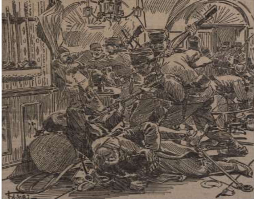
Çizim 2: Yunan Askerleri Tarafından Bir Türk Kahvehanesine Baskın ( Illustrierte Kronen Zeitung , "Griechen Soldate Schiessen in Einem Kaffehaus die Gäste Nieder". 28.10.1912. s.1

201/014274, 16.12. 1912, s. 74) Selanik limanında bulunan Fransız donanmasına ait Bruix 9 isimli bir savaş gemisinin de Selanik'teki sivillere karşı gerçekleştirilen saldırıları gördüğü malumatını veren Alman konsolosluğu, şiddetin belirli bir seviyeye ulaşması sebebiyle Müslüman halka yardım etmek zorunda kaldıkları notlarını düşmüştür. (PAAA, RZ 201/014274, 14.12. 1912, s. 33)