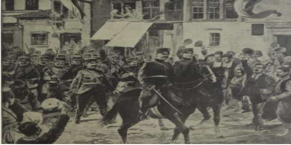
Çizim 1: Yunan Askerlerinin Selanik’e Girişi ( Das Interessente Blatt . “Einmarch der Griechen in Seloniki”. 14.10. 1912. s.1

Selanik’in işgal edilmesi neticesinde Yunan ve Bulgar ordularının şehre girmesi üzerine Alman konsolosluğu raporlarına gelişmeleri aktarmaya başlamıştır. Alman konsolosluğu bir Bulgar alayının Selanik’e girmesi ile birlikte Yunan askerlerinin onları alkışlamaya başladığı ve Bulgar askerinin de onlara selam verdiğini belirtmiştir. (PAAA, RZ 201/14274, 18.11.1912, s. 45) Almanların bölgedeki Türklere yapılan hukuksuzluklarla ilgili ilk bilgileri 15 Kasım 1912 tarihinde verdiği görülmekle birlikte Yunan ve Bulgar askerlerinin yolda karşılaştıkları Türklerle sorgusuz-sualsiz arama yaptıkları ve hatta şehirdeki Almanların da aynı muameleye maruz kaldığı, Bulgar askerlerinin bir Alman papaza saldırıp onu tutukladıkları bilgisini vermektedir. (Politisches Archiv des Auswärtigen Amts(PAAA, RZ201/014274, 15.10. 1912, s. 52) Yunan ve Bulgar askerlerinin Türklerin evlerine girip haksız ve hukuksuz bir şekilde arama yaptıklarına dair kendisine şikayetler geldiğini ifade eden Alman konsolosluğu işgalci güçler tarafından sivillerin öldürüldüğünü belirtmiştir. (PAAA, RZ201/014274, 15.10.1912, s. 52) Alman konsolosluk raporlarında önceleri Türklere karşı saldırı noktasında Bulgarların daha fazla vurgulandığı görülse de ilerleyen süreçte Yunanlıların daha fazla ön plana çıkartıldığı anlaşılmaktadır.