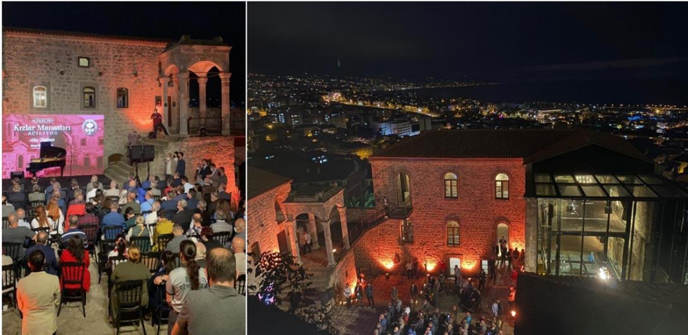
Şekil 2. Kızlar Manastırı açılışı

Yaklaşık 5 yıl süren restorasyon çalışmalarının ardından manastır, 10 Eylül 2021 tarihinde ünlü piyanist besteci Tuluyhan Uğurlu'nun konseri ve düzenlenen törenle ziyarete açılmıştır. Günümüzde yaşayan müze, performans etkinlikleri ve sanat galerileri olarak kullanıcılara hizmet vermektedir (Şekil 2).