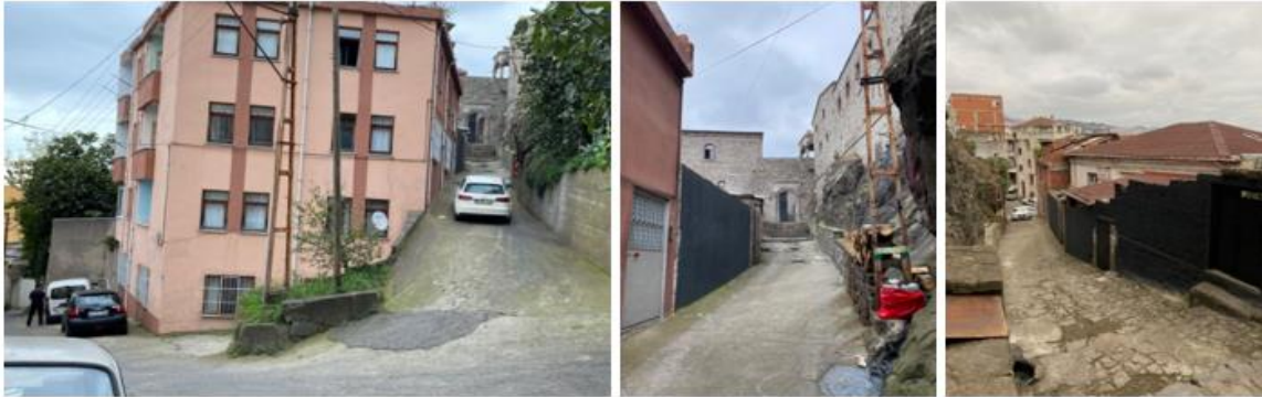
Şekil 3. Manastırın girişi ve yakın çevresi

Trabzon'un kente hâkim bir noktasında eğimli bir arazide konumlanan Kızlar Manastırı'nın yakın çevresinde konutlar bulunmaktadır. Kent merkezine yakın konumu sebebiyle ulaşımı kolay sağlanmaktadır. Ziyaretçiler kendi araçları ile ya da toplu taşıma araçları ile yapının yakınlarına gelebilmektedir. Yapıya erişim Boztepe yolundan ayrılarak dar bir ara sokak aracılığıyla gerçekleşmektedir (Şekil 3).