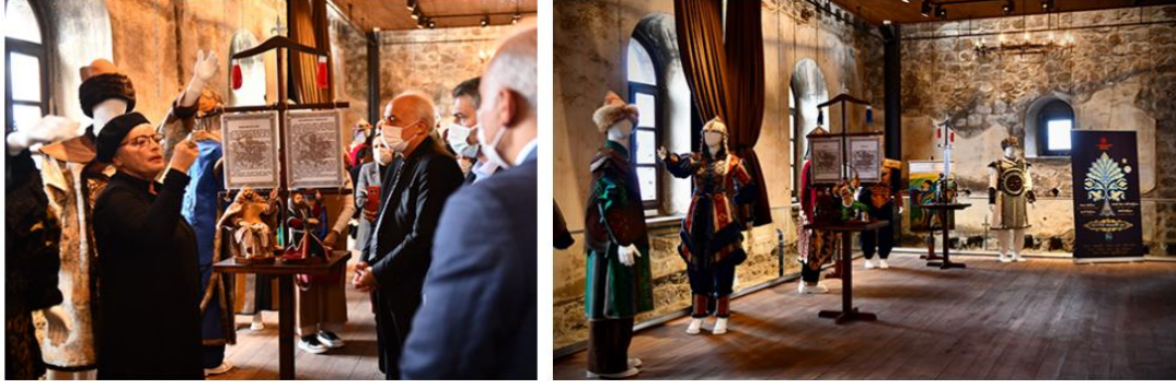
Şekil 5. “Bir Zamanlar Selçuklu” sergisi (Gazete Kuzey, 2021)

Tarihî dokusuyla yerli ve yabancı turistlerden ilgi gören manastır, turizm faaliyetleri açısından ön plana çıkmasının dışında Trabzon’un tarih, kültür ve sanat hayatına canlılık katmaktadır. Buna ek olarak manastıra öğrenciler için de geziler düzenlenmektedir. Bu da günümüz neslinin geçmişi hakkında fikir edinmesine ve kültürel-tarihsel yönden bilgilenebilmesine de önemli bir katkı sağlamaktadır. 10 Eylül 2021 tarihinde açılışı gerçekleştirilen ve kısa zamanda ziyaretçilerin yoğun ilgisi ile karşılaşılan Kızlar Manastırı’nda, sanatsal ve kültürel etkinliklerin yapılması yönünde çalışmalar devam etmektedir.