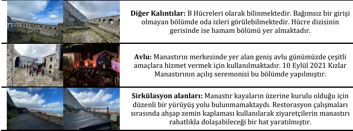
Tablo 3. Kızlar Manastırı'na ait yapıların mekânsal/işlevsel özellikleri

Kızlar Manastırı süreç içerisinde özgün işlevinden farklı bir işlevler kullanılmamış, 20. yüzyılda kentte yaşanan mübadele dönemi sonrasında bakımsız kaldığı dönem olmuştur. Yapının mekânsal/işlevsel açıdan değerlendirmeleri bağlamında, insan faktörü, sirkülasyon, iş ve ihtiyaç programı akışı, esneklik, kullanım ve özelleşme kriterleri açısından olumsuz bir değişikliğin yapılmadığı ve özgün işlevi ile uygun dönüşümlerin yapıldığı görülmektedir.