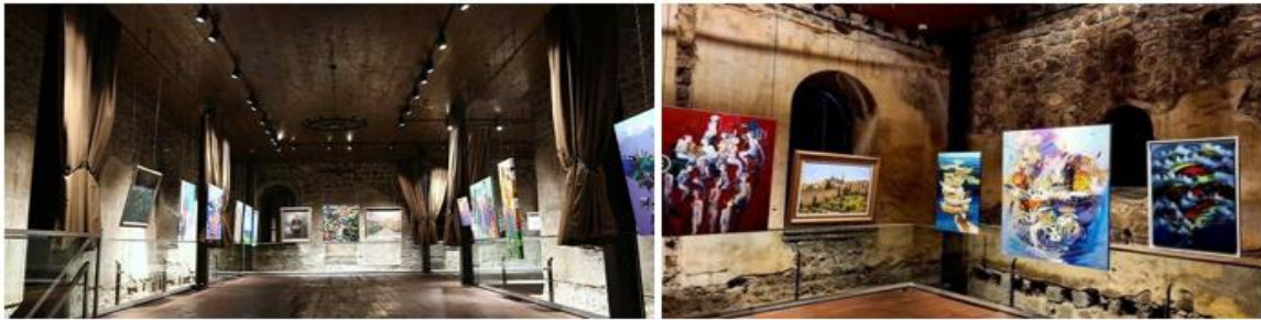
Şekil 4. "Trabzon'un Renkleri" sergisi

Kızlar Manastırı, restorasyon sürecinde özgün değerlere kalıcı müdahaleler gerektirmeyen bir dönüşüm geçirmiştir. Bu durum sosyo-kültürel açıdan yapıda herhangi bir olumsuzluğun ortaya çıkmamasını sağlamıştır. Günümüzde açılışı ile birlikte, kullanıcıların hem orijinal işlevinin farkında olması hem de yeni işlevi özgün tarihî değerler ile karşılaşılarak deneyimlemesi kullanıcılar için sosyo-kültürel fayda sağlamaktadır. Bir tarihî eser olarak gezilip görülmenin dışında bünyesinde çeşitli sanatsal ve kültürel etkinliklere de hizmet veren Kızlar Manastırı'nda, 10 Eylül 2021 tarihinde gerçekleştirilen açılışından bugüne kadar iki farklı sergi düzenlenmiştir. Bunlardan birincisi "Trabzon'un Renkleri" isimli sergidir ve Trabzon'da yaşayan ressamların eserleri sergilenmiştir. Yaklaşık 2 hafta boyunca sergilenen eserler ziyaretçiler tarafından ilgi toplamıştır (Şekil 4).