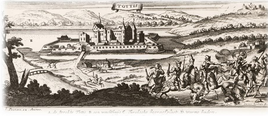
Resim 7: Tata Kalesi