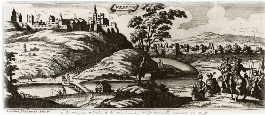
Resim 8: Vespem Kalesi