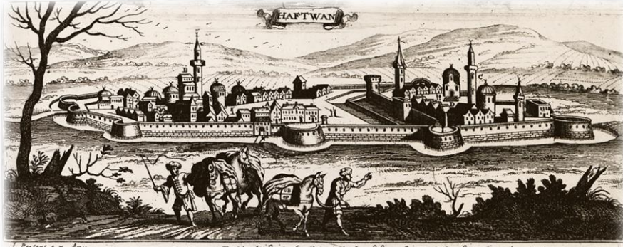
L. Pestori. ex. v. Anv. A. de Stadt Hatwan. B. Stadt Kirche. C. hat Castr. B. Kirche. D. Castr. E. Proviantthur.