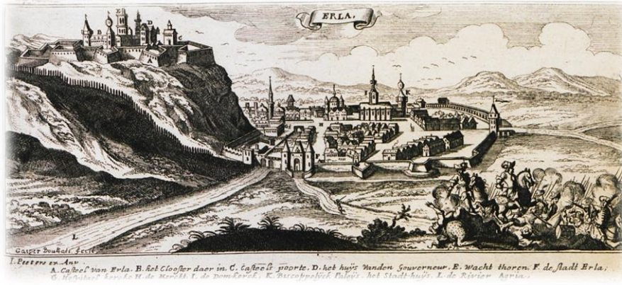
Resim 1: Eğri Kalesi 9