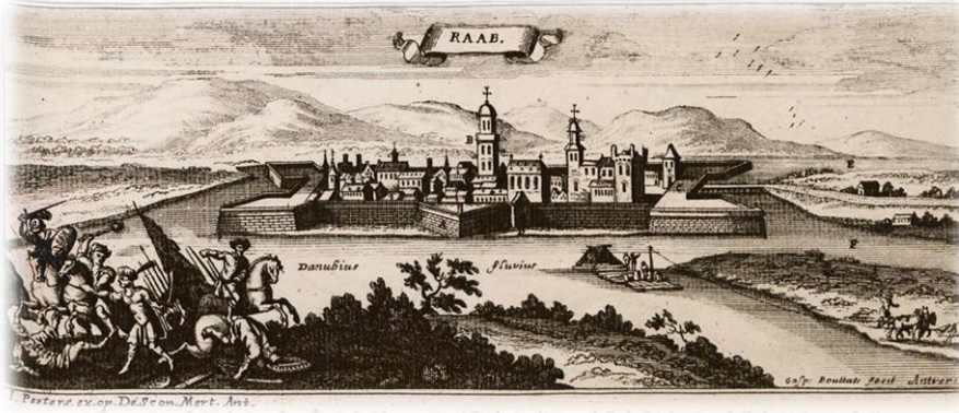
Resim 2: Győr (Yanık, Raab) Kalesi