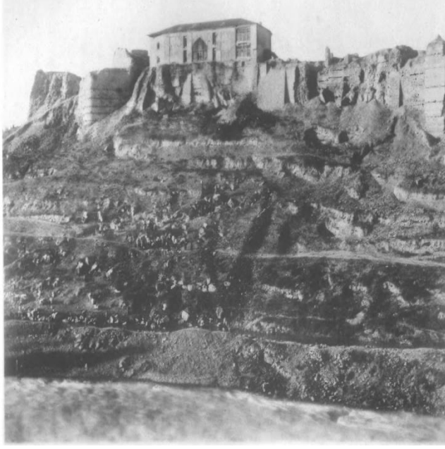
Erivan Kalesinin Zengi (Razdan) Nehri tarafından görünüşü