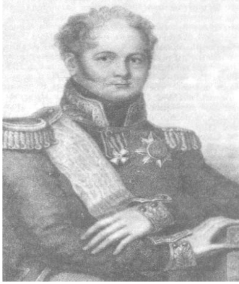
Çar I. Aleksandr