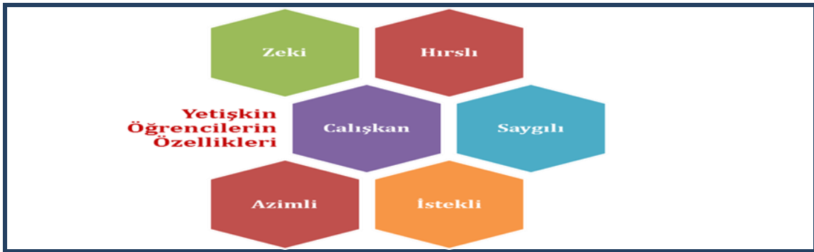
Şekil 1: Türkçe Kurslarına Katılan Mülteci ve Sığınmacılara Dair Öğretmenlerin İzlenimleri

Katılımcılara Türkçe öğrettikleri hedef kitleye ilişkin genel izlenimlerinin nasıl olduğu sorusu yöneltilmiştir. Mülteci ve sığınmacıların hayatın bütün zorluklarını gördükleri için çok çalışkan olduklarını, birbirlerine sahip çıkmaya, yardımcı olmaya ve tutunmaya çalıştıklarını ve onlara sevgilerini verdiklerinde bunun karşılığını aldıklarını dile getirmişlerdir.