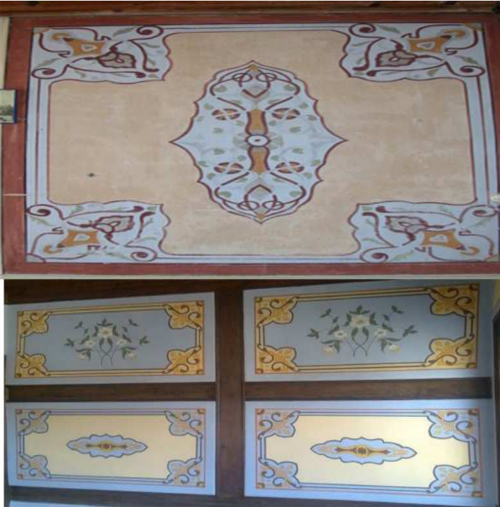
Fotoğraf: 15, Taraklı Çakırođlu Evi'nde kalemîşi duvar bezemeleri