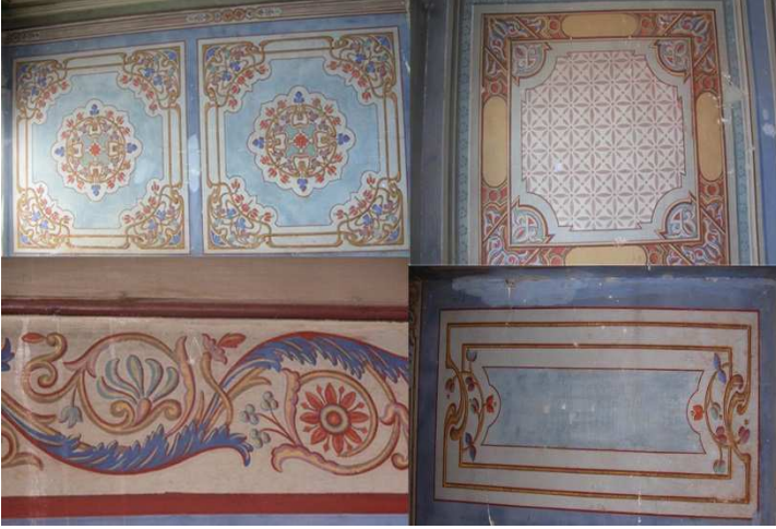
Fotoğraf: 14, Geyve Antakyalı Aki Efendi Evi'nde kalemîşi bezemeler