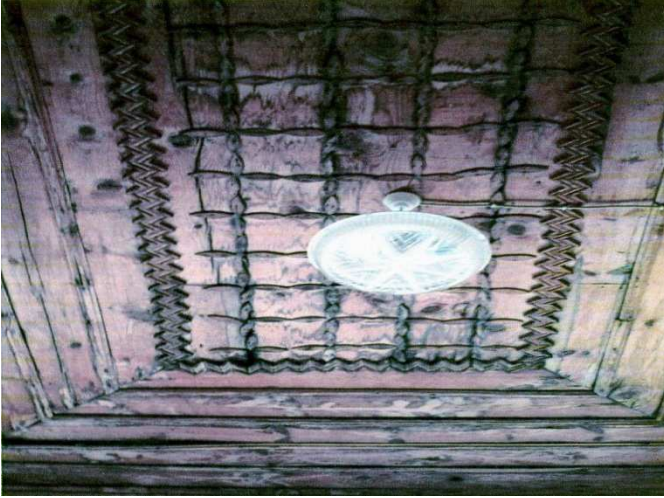
Fotoğraf:10, Taraklı Selahattin Kozcağız Evi ahşap tavan bezemesi