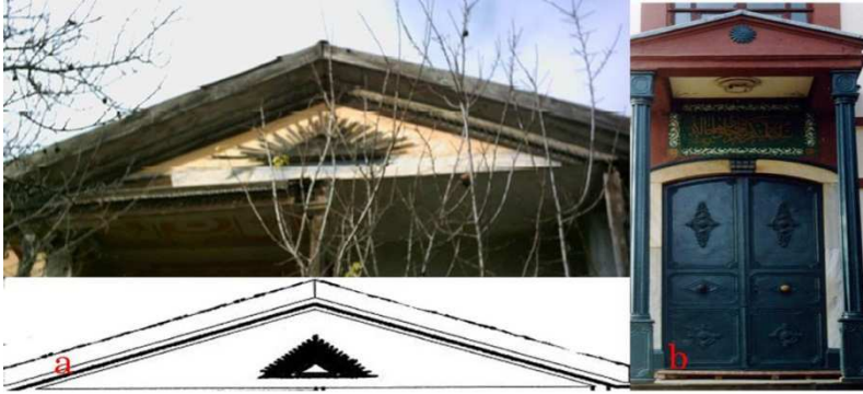
Fotoğraf: 2 a, Taraklı Mürvet Tanyel Evi güneş motifi, b. Sapanca Hasan Fehmi Paşa Camii giriş kapısında güneş motifi