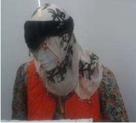
Fotoğraf: 1, Ordu Paşaoğlu Konağı ve Etnografya Müzesi'nde Bulunan İğne Oyalı Yemeni