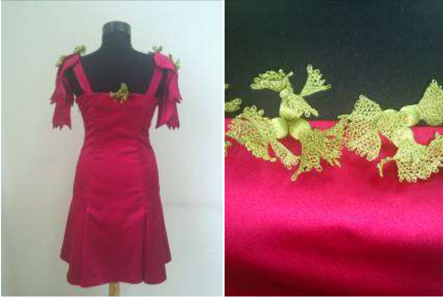
Fotoğraf: 19-20, Giysi Tasarımının Arkadan Görünümü ve Süsleme Detayı