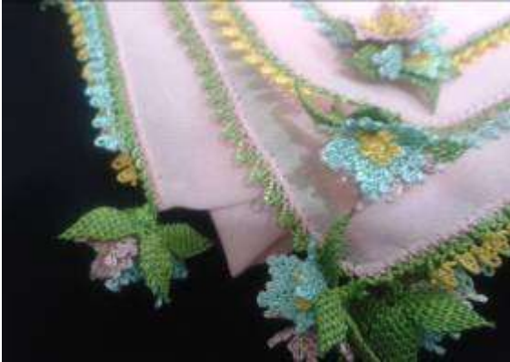
Fotoğraf: 13, Raşan Nur Şahin Tarafından Yapılmış Yemeni Süslemesi