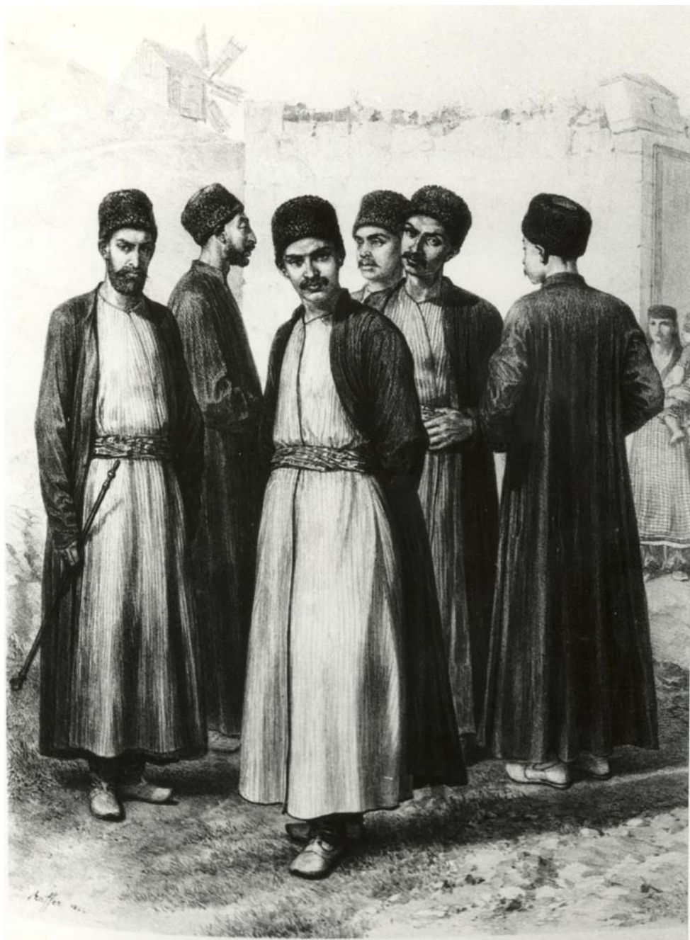
Крымские караймы (из альбома Огюста Раффе, ок. 1837) Crimean Karaites (Auguste Raffet, 1837)