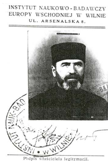
Серая Шапшал в Вильне в 30-ые гг. XX в. Seraja Szapszał in Wilno in the 1930s.