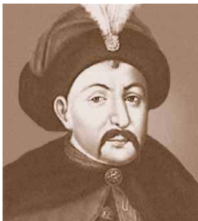
Козацкий гетман Богдан Хмельницкий, отец Тимофея Хмельницкого Cossack hetman Bohdan Chmielnicki, the father of Timophei Chmielnicki