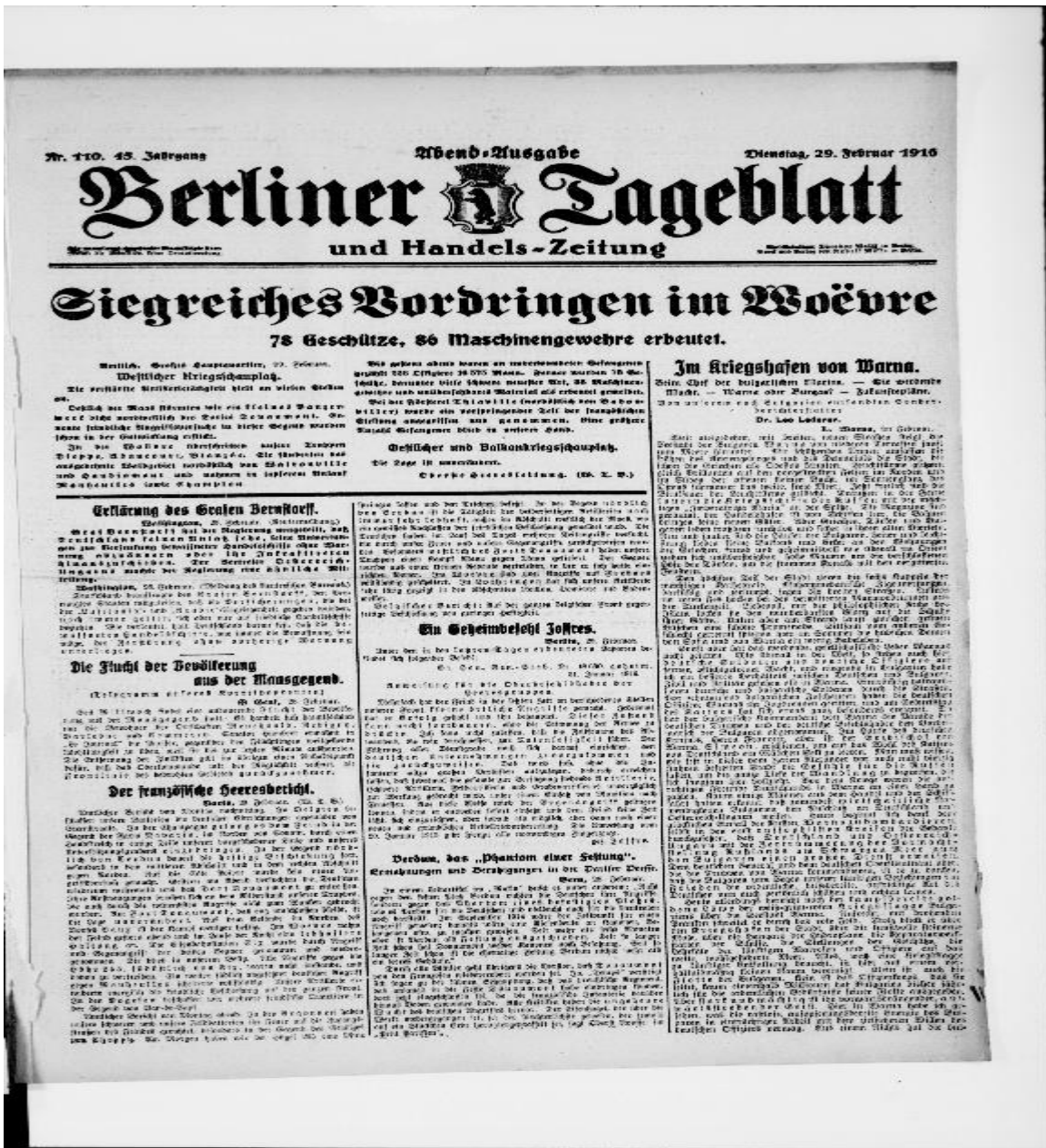
EK 1: Leo Lederer'in Varna Limanı Üzerine Makalesi-1 Leo Lederer (29 Şubat 1916). "Im Kriegshafen von Warna". Berliner Tageblatt und Handels Zeitung. Sayfa No: 1