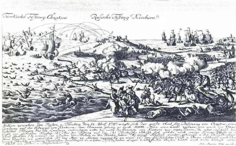
Kilburun muhasarası http://wars175x.narod.ru/img/Btl06.jpg (11.12.2014)