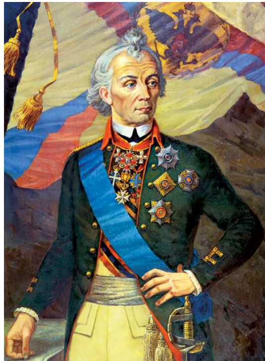
A.V. Suvorov'un portresi http://www.liveinternet.ru/users/3895602/post160448994/ (11.12.2014)