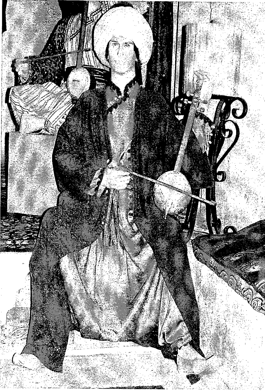
Sanatçı kabak kemane ile solo yaparken.