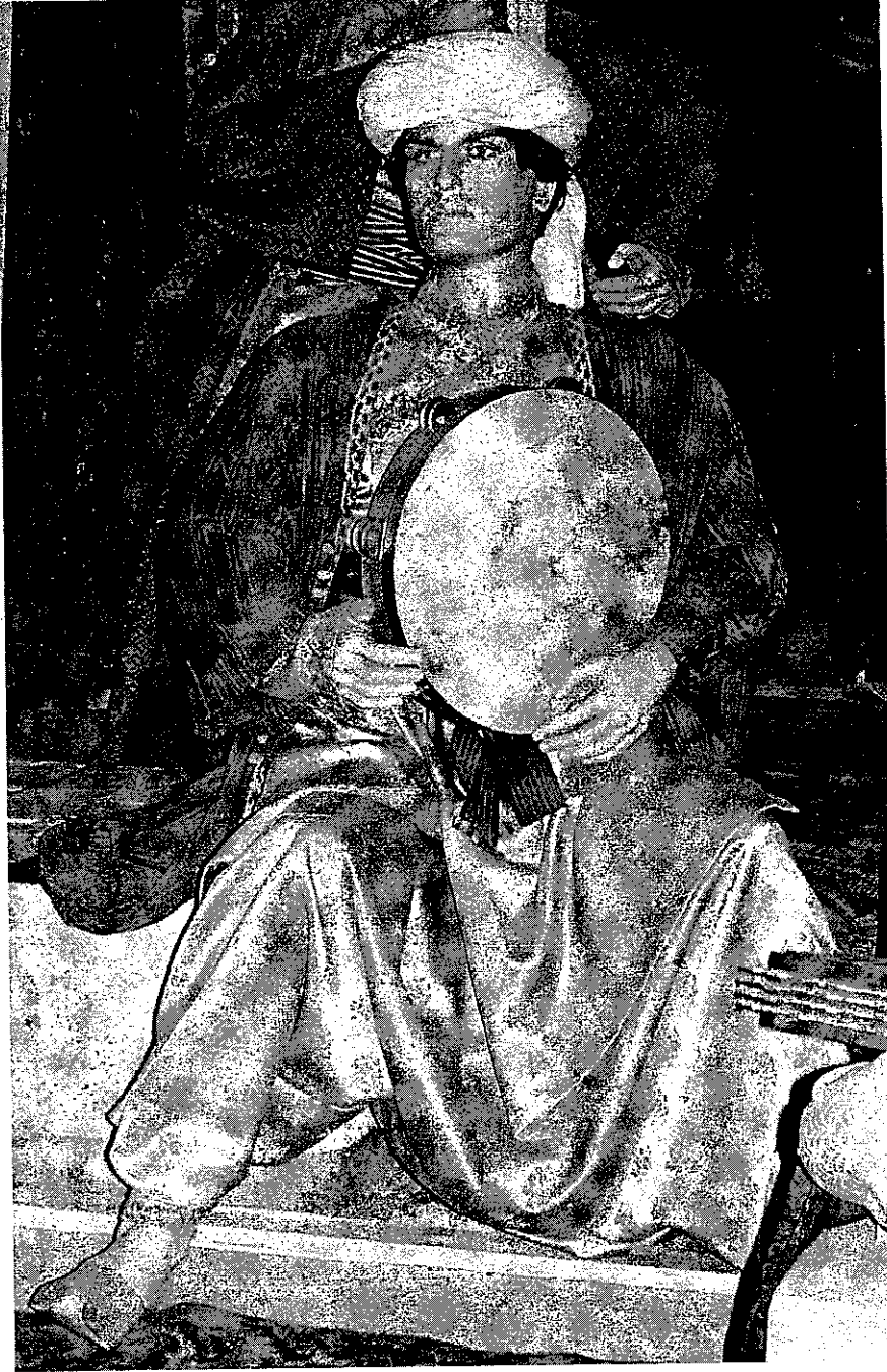
Sanatçı def ile solo yaparken. (Fotoğraf II. Beyazıt Külliyesi Darüşşifası'nda Ekim 2006 tarihinde tarafımızdan çekilmiştir.)