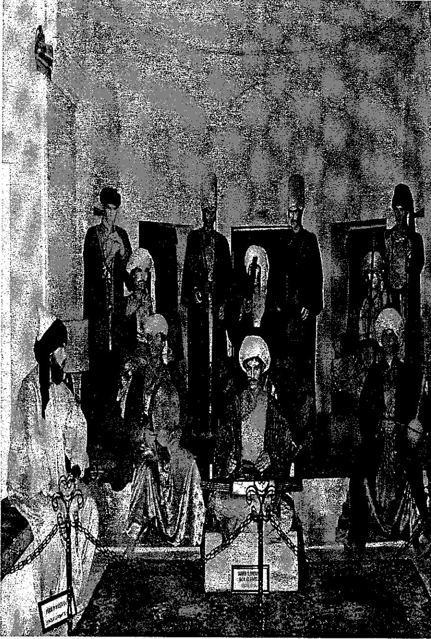
Sazendeler toplu halde hastalıkların tedavisinde kullanılan makamları icra ederlerken.