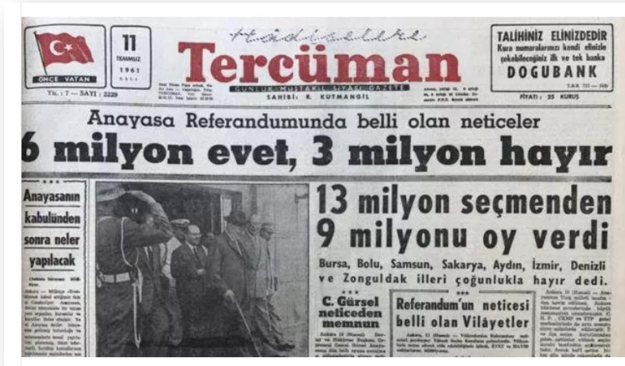
EK 8: Tercüman Gazetesi, 11 Temmuz 1961, Anayasa'nın Halk Oylamasına Sunulmasının Sonucu