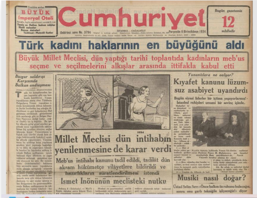
EK 9: Cumhuriyet gazetesi,

6 Aralık 1934, Kadınlara Seçme ve Seçilme Hakkının Verilmesi