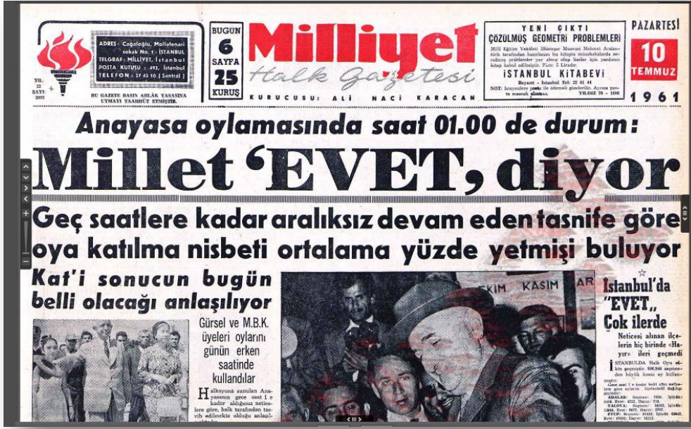
EK 7: Milliyet Gazetesi, 11 Temmuz 1961, Anayasa'nın Halk Oylamasına Sunulmasının Sonucu