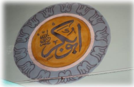
Fot. 18 Ebu Bekir Radiyallahu anh yazısı