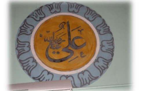
Fot. 25 Ali Radiyallahü anh yazısı