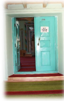
Fot. 15 Harime girişi sağlayan kapı