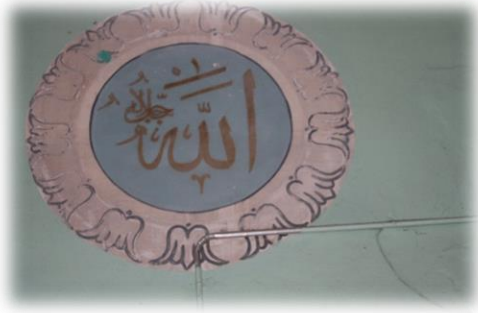
Fot. 22 Allah Celle Celalühü yazısı