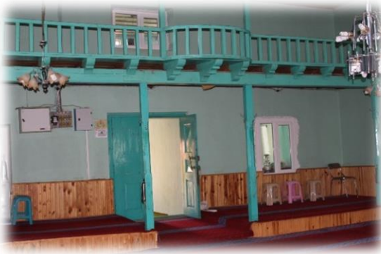
Fot. 9 Kadınlar mahfilinden görünüm