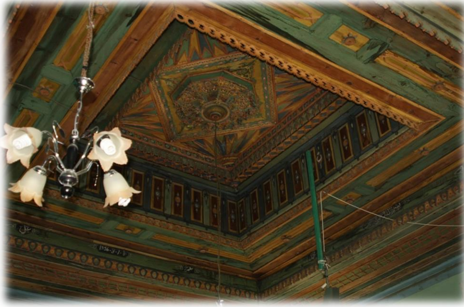
Fot. 8 Harimin tavanından genel görünüm