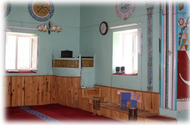
Fot. 14 Vaaz kürsüsünden görünüm