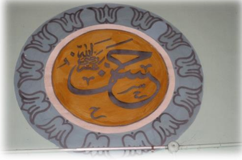
Fot. 20 Hasan Radiyallahu anh yazısı