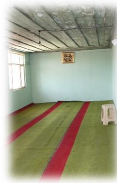
Fot. 10 Mahfilin kuzeyindeki ek bölüm