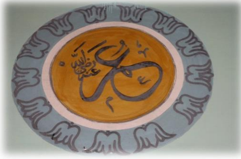
Fot. 26 Ömer Radiyallahü anh yazısı