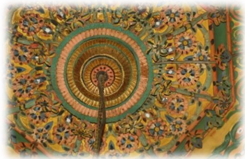
Fot. 47 Bindirme tavanın göbeğinden detay