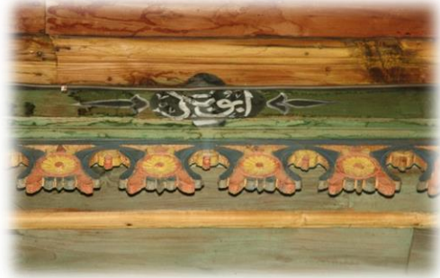
Fot. 41 Bindirme tavandaki Ebubekir yazısı