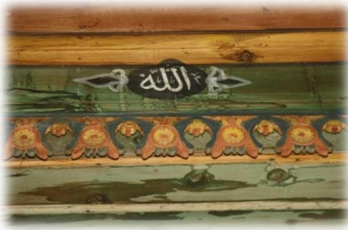
Fot. 30 Bindirme tavandaki Allah yazısı