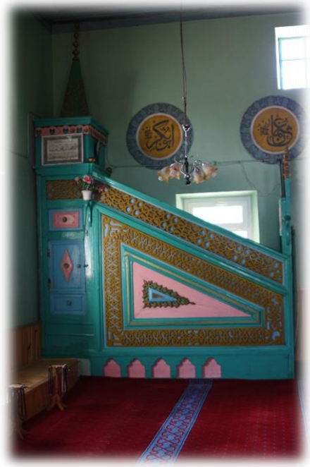
Fot. 13 Minberden görünüm