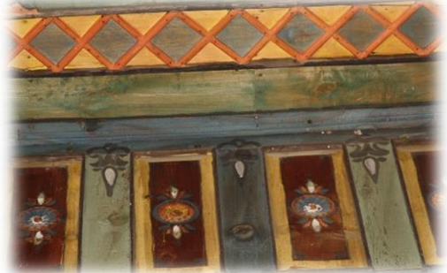
Fot. 43 Bindirme tavandaki ikinci katın kenarı