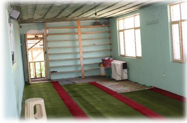
Fot. 11 Mahfilin kuzeyindeki ek bölüme orijinal minare tarafından giriş