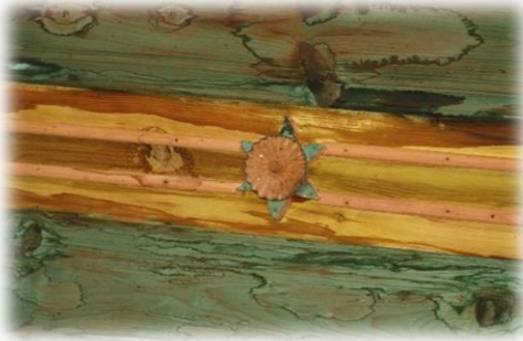
Fot. 42 Bindirme tavandaki altı kollu yıldız motifi