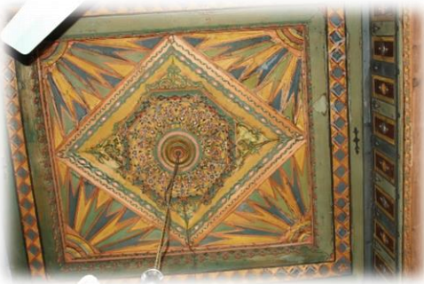
Fot. 46 Bindirme tavanın göbeği