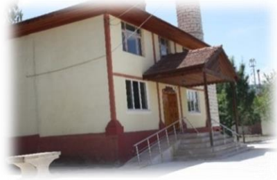
Fot. 4 Yapının kuzey cephesinden görünüm