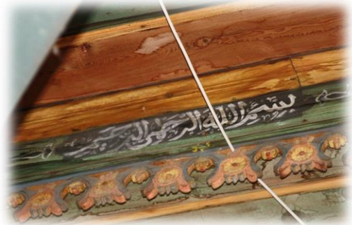
Fot.31 Bindirme tavandaki Bismillahirrahmanirrahim yazısı