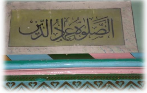
Fot. 21 Mihrap üzerindeki yazı