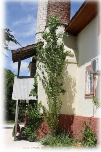
Fot. 2 Orijinal minarenin kaidesi