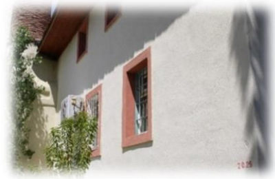
Fot. 6 Yapının batı cephesinden görünüm