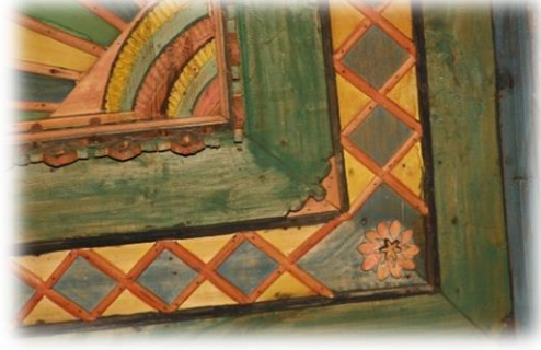
Fot. 45 Bindirme tavandaki köşe motifi