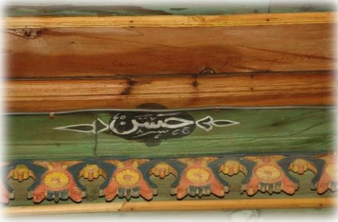
Fot. 36 Bindirme tavandaki Hasan yazısı