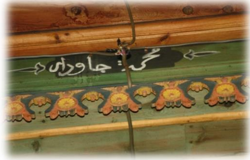
Fot. 37 Bindirme tavandaki Mehmed Çavdar yazısı