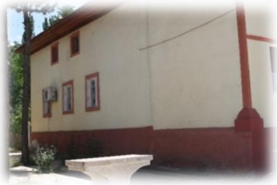
Fot. 5 Yapının doğu cephesinden görünüm