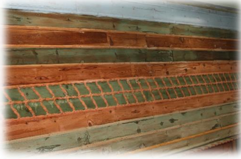
Fot. 28 Tavanın yanlarından görünüm