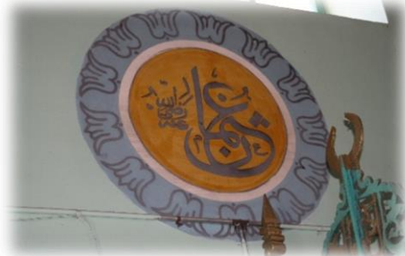
Fot. 19 Osman Radiyallahu anh yazısı