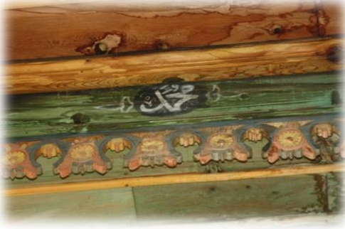
Fot. 32 Bindirme tavandaki Muhammed yazısı