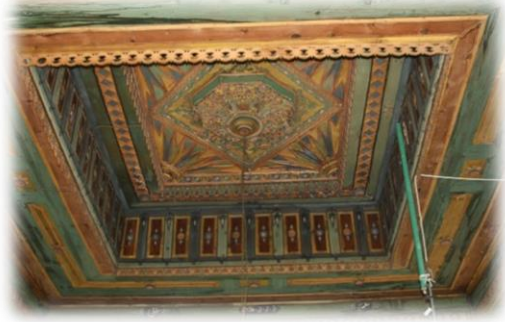
Fot. 27 Bindirme tavandan görünüm