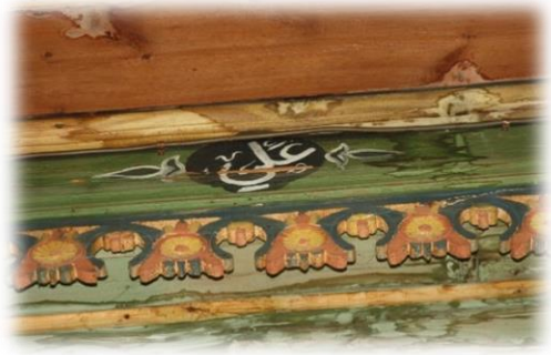
Fot. 35 Bindirme tavandaki Ali yazısı