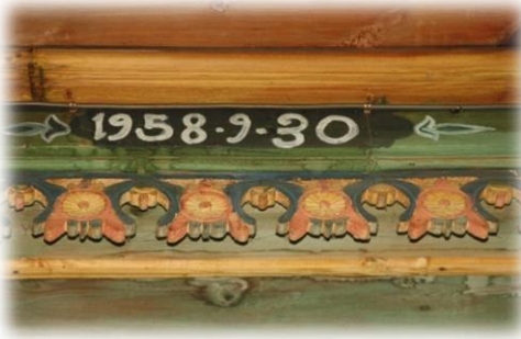
Fot. 40 Bindirme tavandaki inşa bitiş tarihi