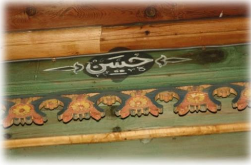
Fot. 38 Bindirme tavandaki Hüseyin yazısı