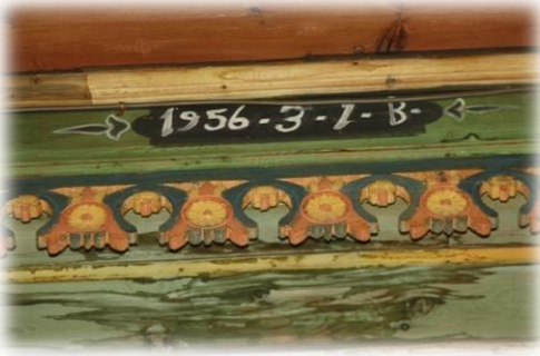
Fot. 34 Bindirme tavandaki İnşa başlangıç tarihi