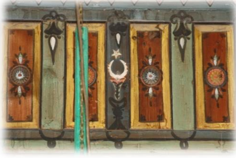
Fot. 44 Bindirme tavandaki hilal ve yıldız motifi