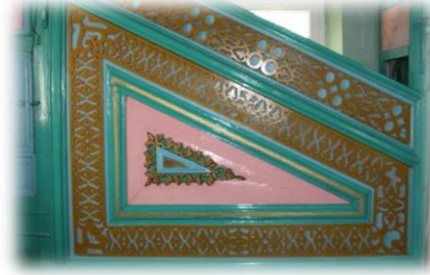
Fot. 17 Minberin aynalık kısmından görünüm