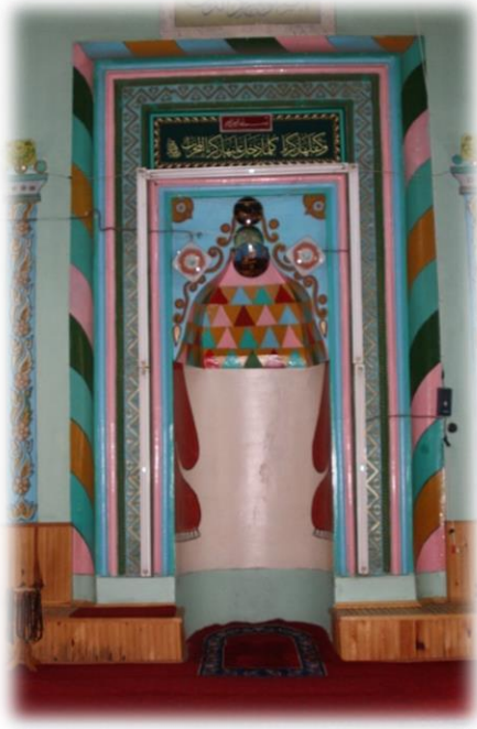
Fot. 12 Mihraptan görünüm