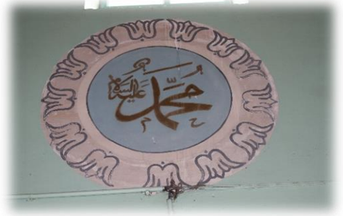
Fot. 23 Muhammed Aleyhisselam yazısı