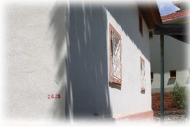
Fot. 7 Yapının güney cephesinden görünüm