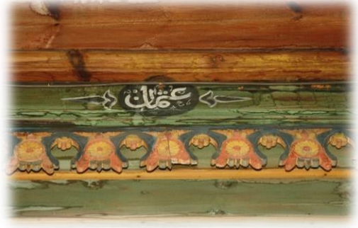
Fot. 39 Bindirme tavandaki Osman yazısı