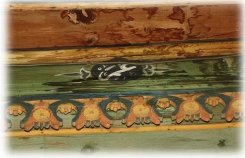
Fot. 33 Bindirme tavandaki Ömer yazısı