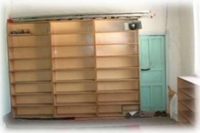
Fot. 3 Son cemaat yerinden minareye çıkış