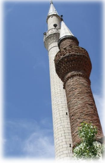
Fot. 1 Yapının minareleri