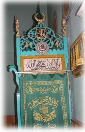
Fot. 16 Minber kapısından görünüm