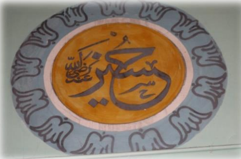
Fot. 24 Hüseyin Radiyallahü anh yazısı