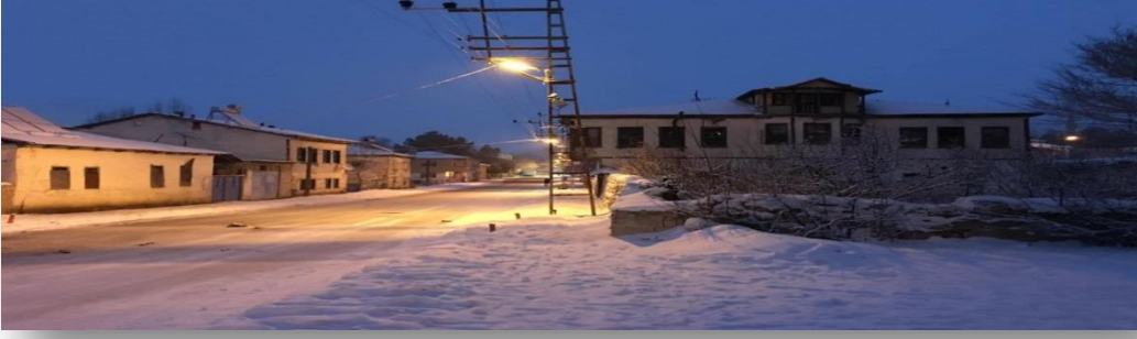
Fotoğraf 2: Ashot Sülalesine Ait Konak-Pınarbaşı İlçesi-10.01.2020