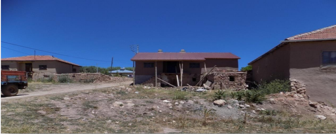
Fotoğraf 19: Yağlıpınar Köyü-12.07.2017

Alan çalışmamız esnasında son dönemlerde bölgede kimyon, anason ve aspir ekimi yapıldığı dile getirilmiştir. Ayrıca Uzunyayla'da sadece erkekler çalışırken, Pınarbaşı'na yakın köylerde kadınlar da çalışarak tarımsal faaliyetlere katılım sağlamışlardır.