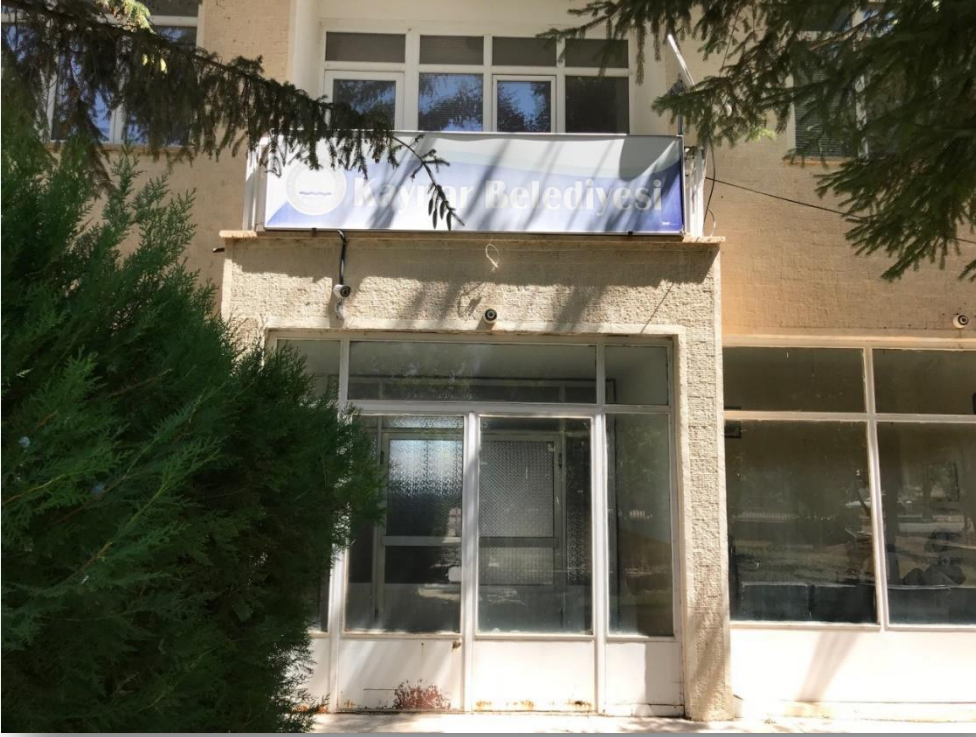
Fotoğraf 22: 30.03.2014'te Kapatılan Kaynar Belediyesi-Kaynar Köyü-23.08.2018

Alan çalışmamız esnasında kaynak kişilerden sıkça duyduğumuz bir konu ise bir dönem belediye olan eczaneye ve sağlık ocağına sahip Kaynar'ın bugün belediye statüsünü kaybedip mahalleye dönüşmüş olmasıdır.