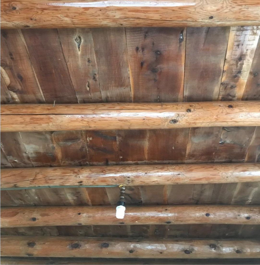
Fotoğraf 21: Hilmiye Köyü-13.10.2019