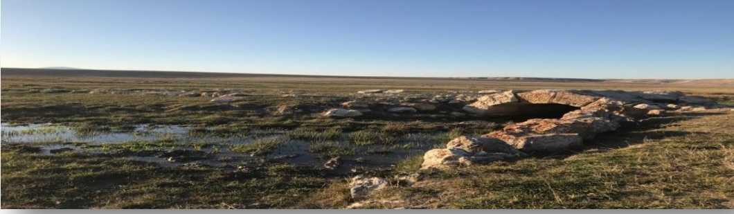
Fotoğraf 3: Roma Yolu Köprüsü ve Mil Taşı-Hilmiye Köyü-13.10.2019