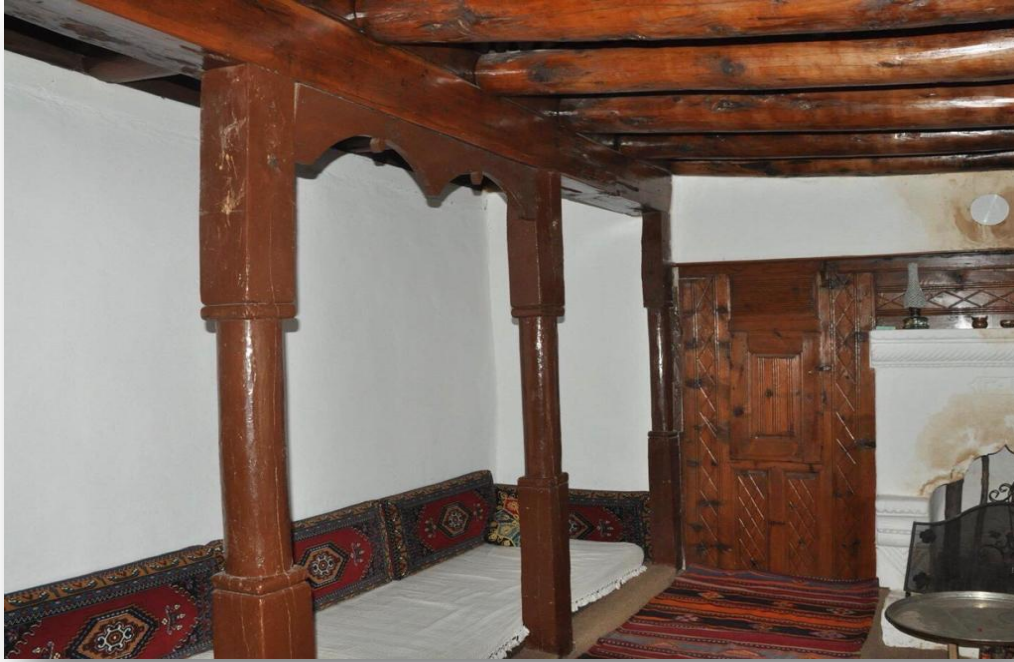
Fotoğraf 25: Guaş Şevket'in Haçeşi-Panlı Köyü

Bir kültür okulu olan dilin, habzenin 5 , halk hikayelerinin ve masalların aktarım mekanı işlevi gören haçeşler günümüzde ya kapalı ya da yıkılmıştır (K.K. :50, 72). Alan çalışmamız esnasında ziyaret ettiğimiz Tahtaköprü (12.07.2017) ve Taşoluk (11.07.2017) köylerinde haçeşleri görme fırsatı yakaladık. Ayrıca Methiye, Dikilitaş, Panlı köyünde de (Siyuh Seferbiy ve Guaş Şevket) haçeşler bulunmaktadır. Günümüzde işlevini yitiren haçeşler sembolik birer hafıza mekanı olarak Uzunyayla'nın köylerinde az sayıda da olsa hala ayakta durmaktadır.