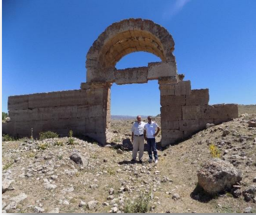
Fotoğraf 6: Kale Kalıntısı-Şerefiye Köyü- 11.07.2017