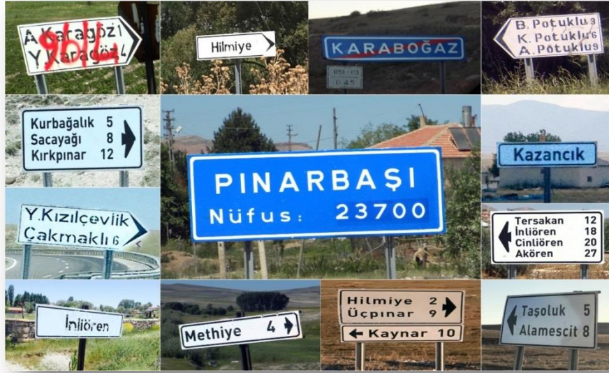
Fotoğraf 1: Köy Tabelaları-2017 (Haziran-Temmuz)-23.08.2018-13.10.2019

“Kafkasya Kökenlilerin Hafıza Mekanları Üzerine Bir Araştırma” başlıklı Tübitak 1001 projesi kapsamında 2017 yılının Haziran-Temmuz, 2018 yılının Mayıs-Ağustos ve 2019 yılının Ekim aylarında Kayseri merkez, Pınarbaşı ilçe merkezi ve Pınarbaşı'na bağlı köylerde gerçekleştirdiğimiz alan çalışmasında Akören, Altıkesekek, Aşağıborandere, Aşağıkaragöz, Devederesi, Eğrisöğüt, Gebelek, Halitbeyören, Hilmiye, İnlören, Karaboğaz, Karakuyu, Kaynar, Kazancık, Kılıçmehmet, Kurbağalık, Methiye, Olukkaya, Örenşehir, Panlı, Sacayağı, Şerefiye, Tahtaköprü, Taşoluk, Üçpınar, Yağlıpınar, Yukarıbeyçayır, Yukarıkaragöz ve Yukarıkızılçevlik köyleri olmak üzere toplam 29 köy tarafımızca ziyaret edilmiştir. 1