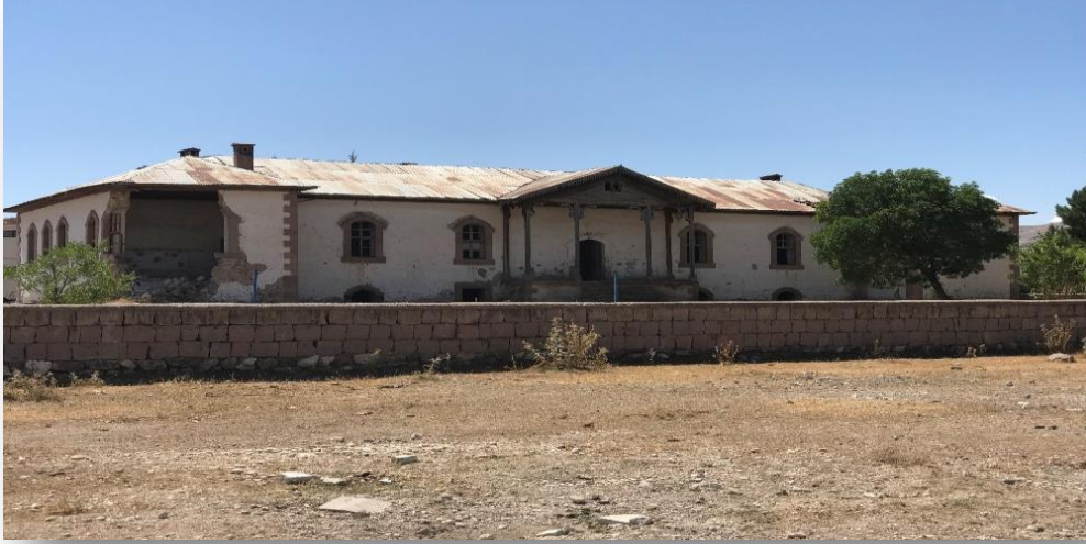
Fotoğraf 16: Kaynar'daki Eski Okul-23.08.2018