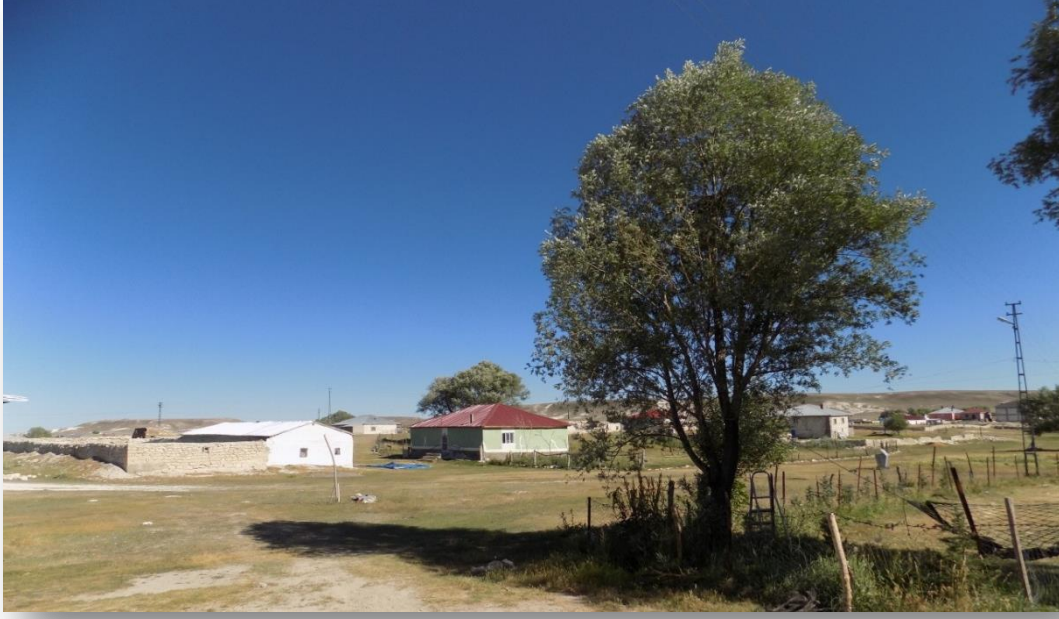
Fotoğraf 10: Uzunyayla Bölgesi-Methiye Köyü-11.07.2017