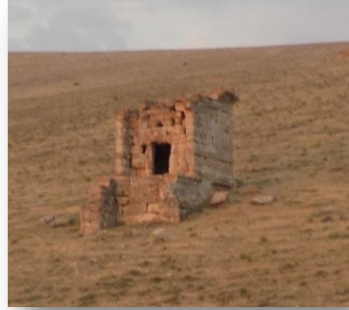
Fotoğraf 7: Panlı Anıt Mezarı-Panlı Köyü- 16.07.2017