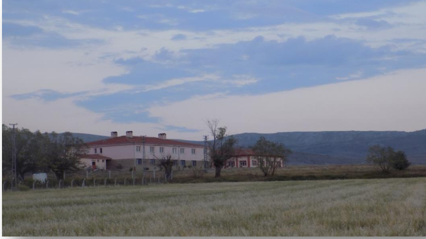
Fotoğraf 12: Panlı İlkokulu ve Ortaokulu-16.07.2017

Pınarbaşı civarı ve Uzunyayla köylerinde ikamet eden çocuklar mesafelere göre Pınarbaşı'ndaki okullara, Karakuyu İlkokul ve Ortaokuluna, Kaynar İlkokulu ve Ortaokuluna gitmektedirler.