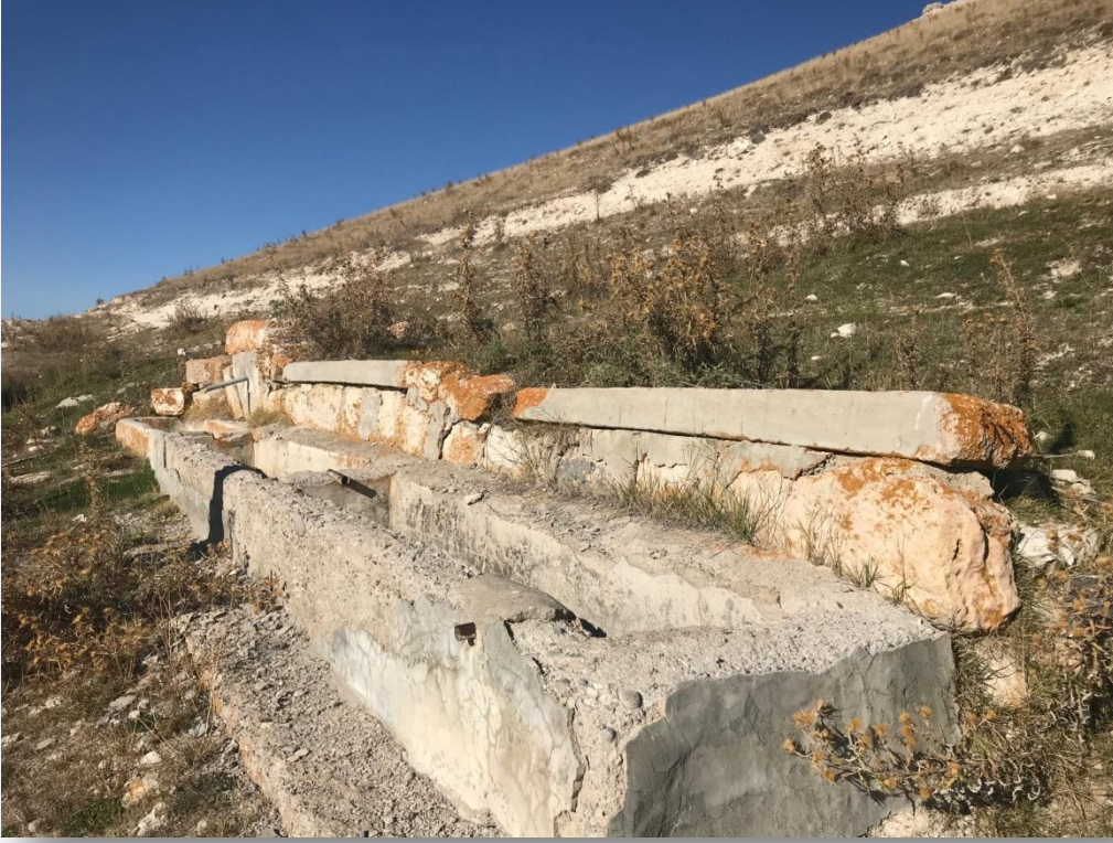
Fotoğraf 24: Kenet Puarı (pınarı)-Hilmiye Köyü-13.10.2019

Hilmiye köyündeki Kenet pınarı ve Hajdımpınarı sırtı sülalenin mensuplarının etnik kimlikleri için hatırlatma işlevi gören hafıza mekanlarıdır. Uzunyayla köyleri bu şekilde pek çok toponim ve hidronime sahiptir. Konu araştırmacıları beklemektedir.