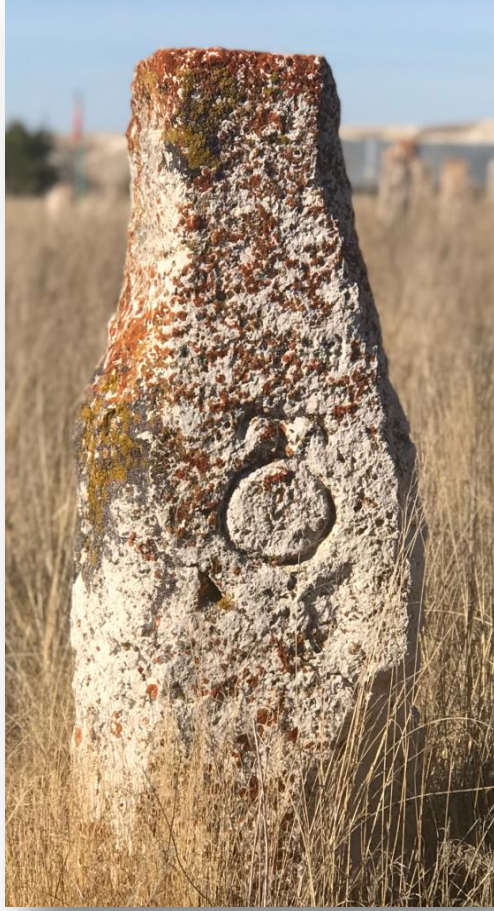
Fotoğraf 29: Sülale Damgası Bulunan Bir Mezar Taşı-Hilmiye Köyü-13.10.2019