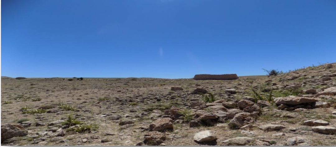
Fotoğraf 18: Şerefiye Köyü-11.07.2017