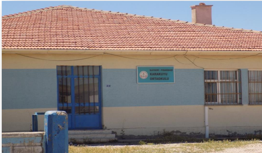
Fotoğraf 13: Karakuyu Ortaokulu-11.07.2017