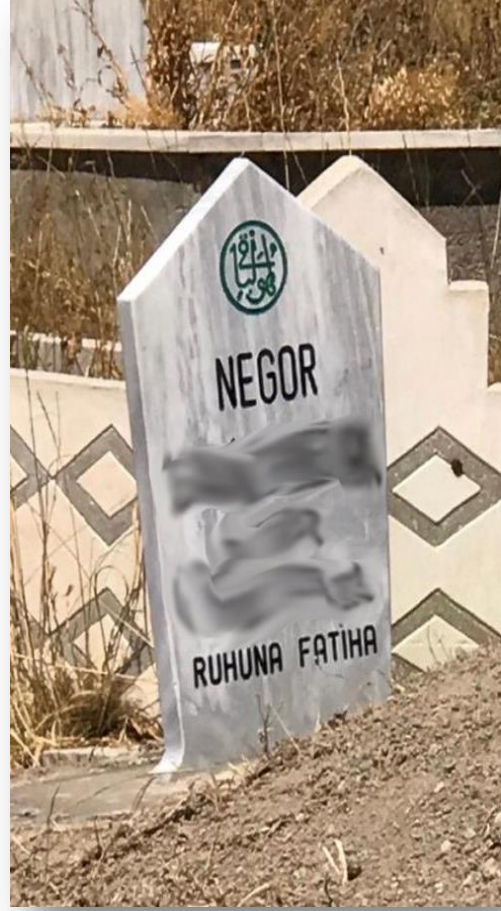
Fotoğraf 30: Sülale İsmi Bulunan Bir Mezar Taşı-Kaynar Köyü-23.08.2018

Toplumun buluşma platformlarından birisi de cenaze törenleri olmuştur. Uzunyayla'da cenaze törenlerinde geleneğe göre köye gelen misafirler köydeki hanelere dağıtılmış ve cenaze evinde yemek yapılmamıştır (K.K. :4, 6, 23, 30, 58, 66, 70, 74). Köy mezarlıklarında yaptığımız gözlemlere göre mezarlıklarda sülalelerin yerleri bellidir. Bu bağlamda düşündüğümüzde kişilerin cenaze ve bayram gibi günlerde yaptığı mezar ziyaretleri, mezar taşlarında bulunan sülale damgaları ve sülale isimleri kişinin etnik kimliği için hatırlatma, geçmiş bilinci oluşturma ve beraberinde hafıza mekanı işlevi görmektedir.