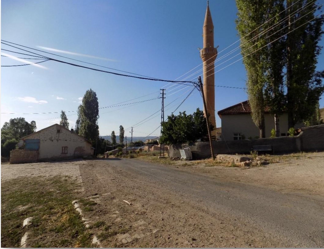
Fotoğraf 9: Pınarbaşı'na Yakın Bölgedeki-Gebelek Köyü-14.07.2017

Alamescit, Altıkesekek, Aşağıborandere, Beserek, Çukuryurt, Hilmiye, Kaftangiyen, Kavak, Kazancık, Kurbağalık, Malak, Methiye, Örenşehir, Pazarsu, Sacayağı, Şerefiye, Tahtaköprü, Taşlıgeçit, Taşoluk, Üçpınar köylerini içine alan bölge ise Uzunyayla olarak adlandırılmaktadır. Bu bölgedeki köy nüfuslarının etnik yapısı Abazalar, Çeçenler ve Çerkeslerden oluşmaktadır. Bölgenin Çeçen nüfusuna sahip tek köyü Aşağıborandere, tek Abzeh köyü Çukuryurt'tur. Altıkesekek köyü Abazaların Aşuva, Kazancık ve Yukarıborandere köyleri Aşharuva grubuna dahildir. Beserek, Kavak ve Malak köyü ise Hatukoy nüfusa sahiptir. Uzunyayla'nın Pınarbaşı'na bağlı köyleri ağırlıklı olarak Doğu Çerkes (Kabardey) grubuna mensuptur.