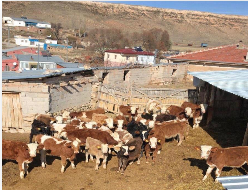
Fotoğraf 17: Akören Köyü-22.11.2019