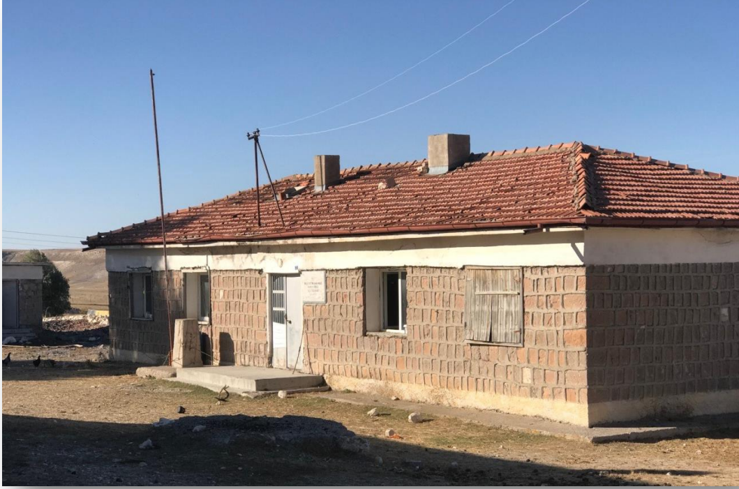
Fotoğraf 11: Kapanan Köy Okullarından Hilmiye Köyündeki Ali Tokmak İlkokulu- 13.10.2019