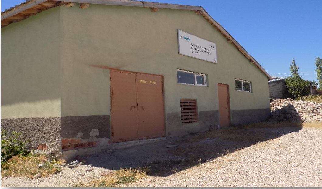
Fotoğraf 20: Kılıçmehmet-Küçükpotuklu Tarımsal Kalkınma Kooperatifi