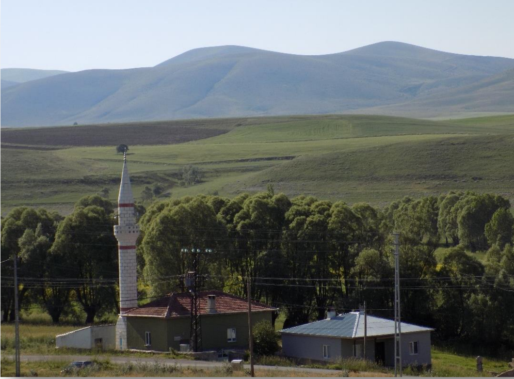
Fotoğraf 8: Çörümşek Bölgesi-Devederesi Köyü-25.06.2017