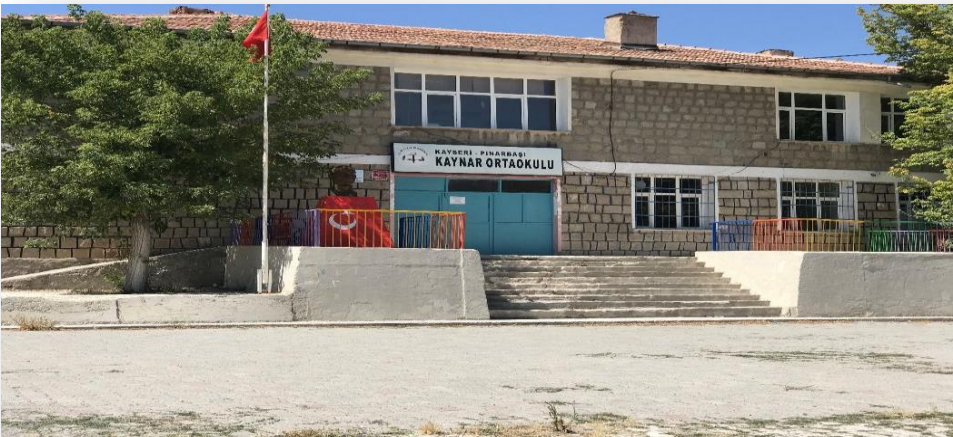
Fotoğraf 15: Kaynar Ortaokulu-23.08.2018