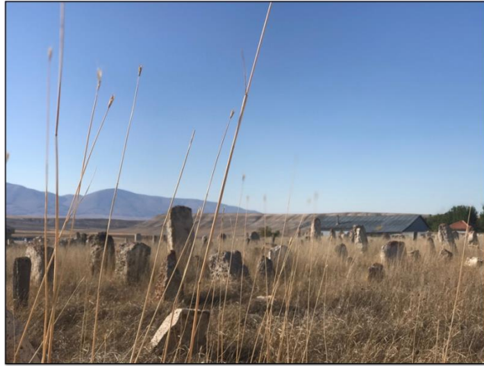
Fotoğraf 4: Hilmiye Köyü Mezarlığı-13.10.2019