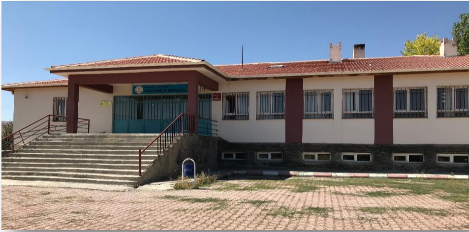
Fotoğraf 14: Kaynar İlkokulu-23.08.2018