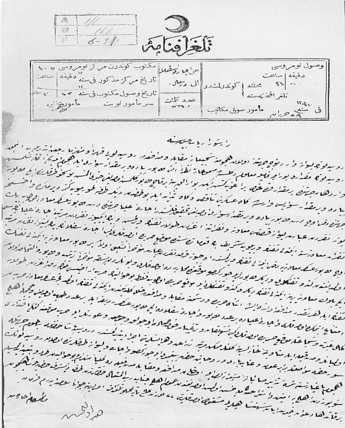
Belge 1: ATASE Arşivi, ORH, K: 5, G: 42, B: 42-1.

(1877-78 Osmanlı-Rus Harbi Sırasında Artvin ve Ardanuç'ta Rus ve Türk Askerleri ve Halkın Durumunu Bildiren, Bölgeden Görevli Yarbay Tarafından Yüksek Askeri Şûra Başkanlığı'na Gönderilen Telgraf).