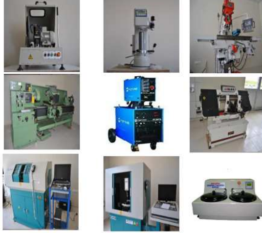
Şekil 2. Makine Laboratuvarı'nda bulunan bazı cihazlar