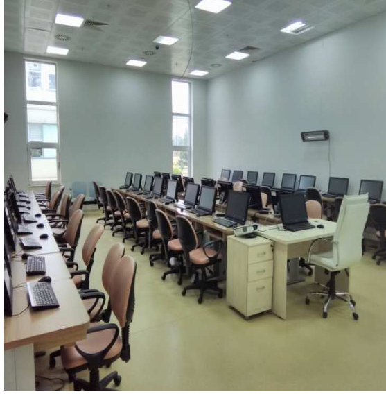
Şekil 4. Bilgisayar Laboratuvarı genel görünüm

Mevcut laboratuvar altyapısı incelendiğinde ileri seviyede teknik altyapının olduğu görülmektedir. Bu makine-donanımlar bir mekatronik teknikerinin sahip olması için gerekli teknik bilgi ve beceri altyapısını sağlayabilecek düzeydedir.