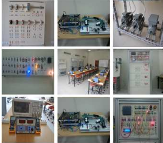
Şekil 3. Elektrik- Elektronik Laboratuvarı'nda bulunan bazı cihazlar