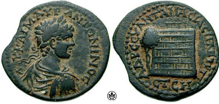
Resim 2: Caracalla. MS 207. Amaseia. Bakır sikke. Ön yüz: AV KAI M AVP ANTΩNINOC, Arka yüz: AΔP CEV ANT AMACIAC, Zeus Stratios Sunağı (SNGCop. 112; BMC Pont. 10, nr. 30).