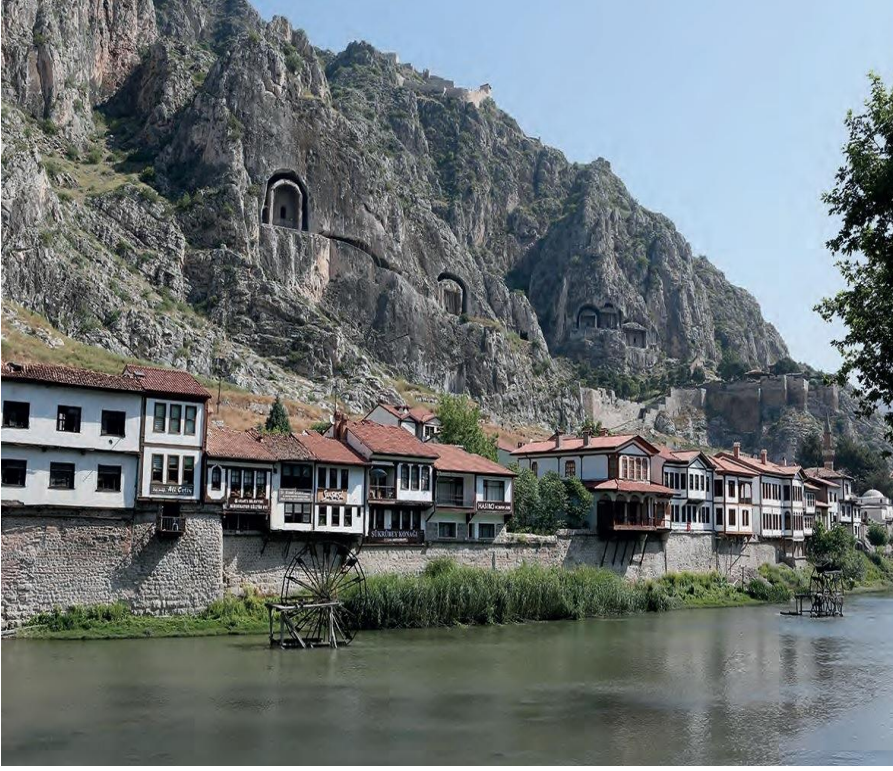
Resim 1: Amaseia Akropolis'inin Eteklerinde Pontus Krallarına ait Kaya Mezarları (Dönmez 2013: 30)