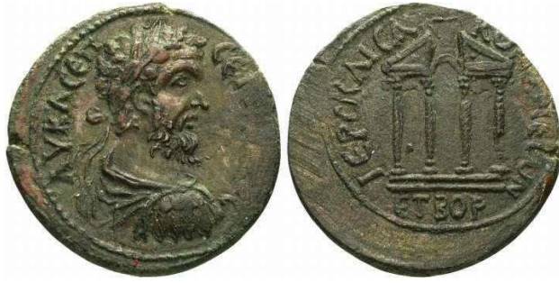
Resim 4: Septimius Severus. MS 193-211. Komana, Pontos. Bakır Sikke. Ön yüz: AY KL CEP CEOYHPOC. Arka yüz: IEPOKAICA KOMANEON, ET BOP. (SNGvA 126).