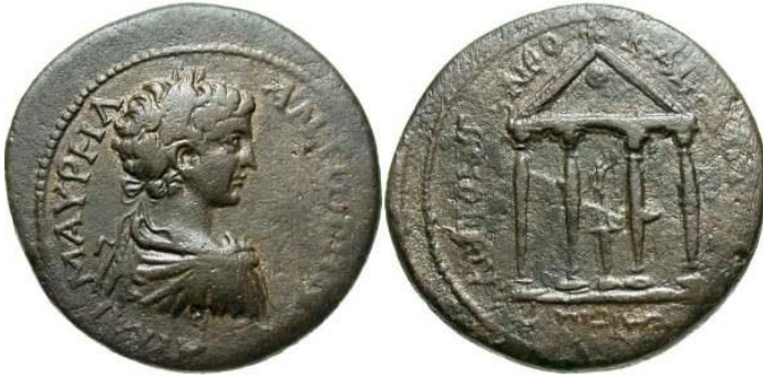
Resim 5: Caracalla. MS 209-210. Neokaesarea, Pontos. Bakır sikke. Ön yüz: AY KAI M AURHL ANTWNINOC, Arka yüz: KOI PONT NEO KAI MHTRO. (SNGvA 6760).