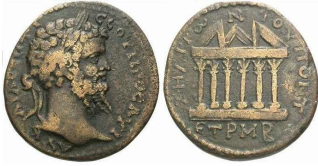
Resim 3: Septimius Severus. MS 205-206. Zela, Pontos. Bakır Sikke. Ön yüz: AY KAI L CEPTI CEOYHROC AYG, Arka yüz: ZHLITWN TOY PONT, ET RMB. (SNGvA 6790).