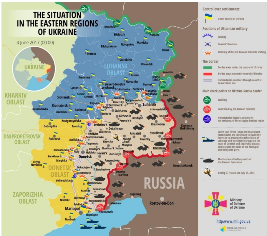
Harita 2: Donbas bölgesindeki savaşın harita üzerindeki son durumu (4 Haziran 2017).

Günümüzde hala devam eden çatışmalar tek başına Ukrayna, ayrılıkçılar ve Rusya arasında olmaktan çıkmış, bölgesel ve uluslararası bir sorun haline gelerek birçok ülkeyi ilgilendirir olmuştur. O açıdan çatışmaların sonlanması artık küresel etkileride hesaba katarak üretilen çözümlere bağlıdır. Ayrıca Rusya'nın ve alandaki ayrılıkçıların tam olarak söylemlerin dışındaki asıl